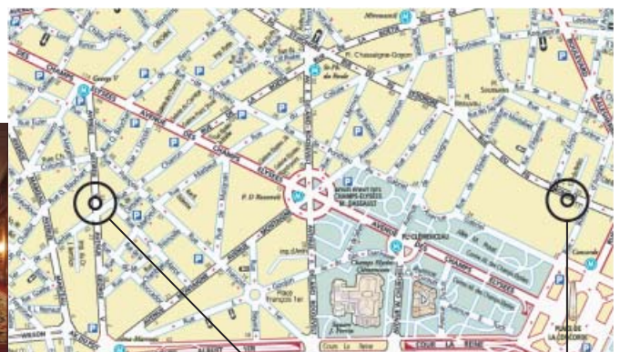
Hôtel George V